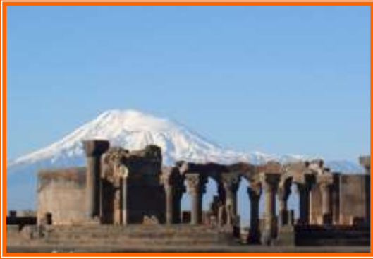
* La Fortaleza Amberd se encuentra a 2.300m sobre el nivel del mar y no se visita hasta mediados de Mayo por nieve

Continuaremos nuestra visita con los Monasterios de Saghmosavank (s. XIII) y Ovanavank (s. IV), al norte de Ashtarak, en el pueblo Atrasaban. El monasterio de Saghmosavank está unido por un antiguo sendero con Hovhanavank, situado a 5 kilómetros al sur y al igual que éste está ubicado en lo alto del empinado desfiladero excavado por el río Kasagh . Los dos templos pertenecen al mismo estilo. La iglesia principal de Saghmosavank es San Sión, construido en 1215 por el príncipe Vache Vachutian. Tras la visita, realizaremos almuerzo en restaurante. Seguiremos nuestro viaje hacia la ciudad de Ashtarak para conocer la Iglesia de Karmavor del s. VII. Por la tarde regreso a Yerevan . Alojamiento en el hotel Ani Plaza 4* . (D.A.-)