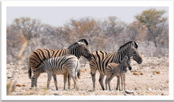
Country hotel (turista). (D.A.C)

Campos de Líquenes donde su guía nos explicará sobre la formación de estas colonias. Después, centraremos nuestra atención en The Brandberg (Las Montañas en Llamas), las cuales son reconocidas como las más altas de Namibia y hogar de la famosa White Lady , un área con más de 45000 pinturas en roca . Realizaremos unas 2 hrs de caminata para visitar las pinturas y dicen tener alrededor de 2000 años de antigüedad (esta visita se realizará este día o al día siguiente). La caminata atraviesa un terreno accidentado a lo largo del desfiladero del normalmente seco río Tsisab. Alojamiento o acampada en el Brandberg White Lady Lodge (turista) , Brandberg Rest Camp (turista) o IGowati