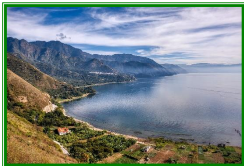
Villa Santa Catarina (turista sup.) . (D.-.-)

uno de los más afamados en toda Latinoamérica, que se celebra con más intensidad cada Jueves y Domingo . Este día realizaremos una Visita Experiencial donde realizaremos con las mujeres locales un taller de tortillas de maíz , el alimento básico de Guatemala. Tras la visita, continuaremos rumbo al Lago Atitlán , del que Huxley dijo ser el más bello del mundo, con sus tres volcanes y sus doce pueblos indígenas. Alojamiento en el hotel Villa Santa Catarina (turista sup.) . (D.-.-)