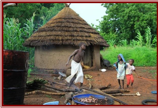
alojamiento en el hotel Le Bedik 3* . (D.A.C)